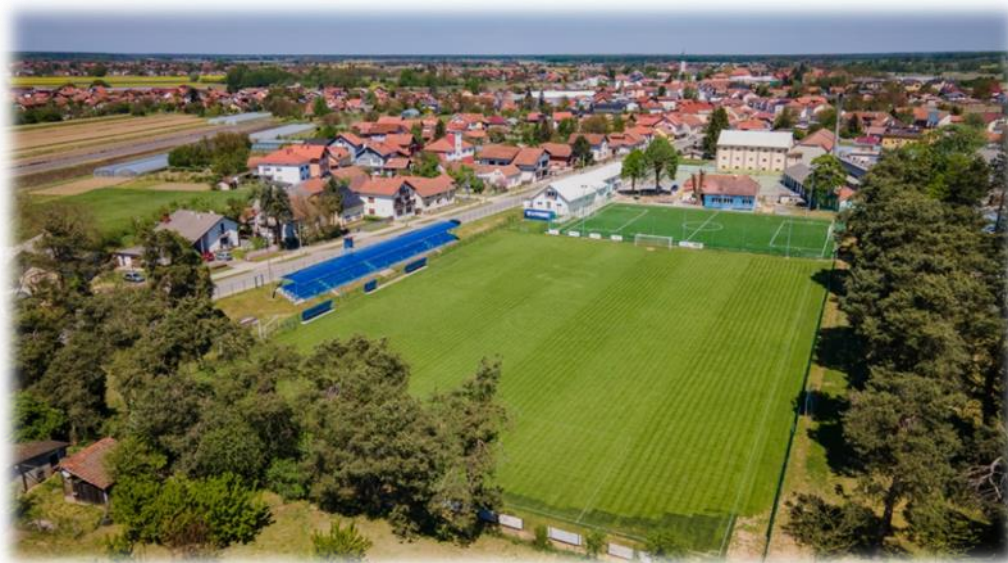
Slika 1. Nogometni stadion u Pitomači

klubovima, kao sportskim udrugama građana, s ciljem poticanja i promicanja nogometa te uključivanja građana, osobito djece i mladeži, u bavljenje nogometom.