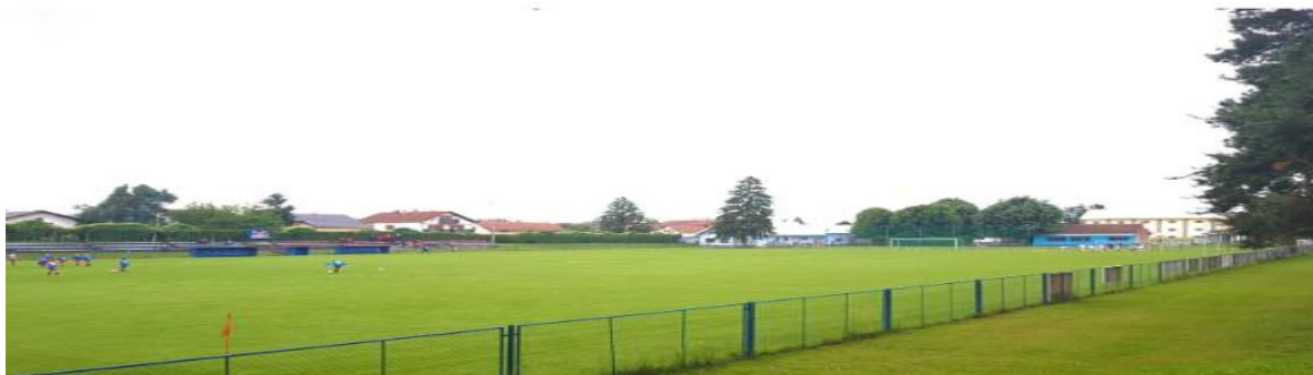
Slika 1. Nogometno igralište Pitomača u Općini Pitomača