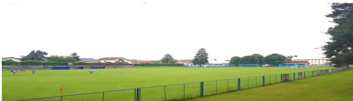
Slika 1. Nogometno igralište Pitomača u Općini Pitomača

Školu nogometa, u okviru svoje djelatnosti, organizirao je Nogometni klub Pitomača. Za nogometni klub Pitomača, osim seniora i mlađih dobnih kategorija, natječu se i sportaši veterani.