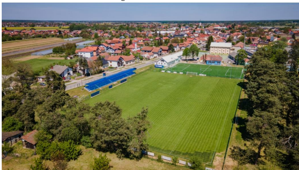
Slika 1. Nogometni stadion u Pitomači

Upravljanje i raspolaganje nogometnim stadionima i igralištima podrazumijeva pronalaženje optimalnih rješenja koja će dugoročno očuvati stadione i igrališta i generirati zadovoljavanje javnih potreba u sportu, odnosno nogometu. Prema podacima lokalnih jedinica, nogometni stadioni i igrališta dani su na korištenje nogometnim klubovima, kao sportskim udrugama građana, s ciljem poticanja i promicanja nogometa te uključivanja građana, osobito djece i mladeži, u bavljenje nogometom.